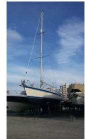
Ready for Inspection