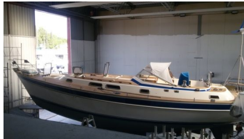
Spieglein, Spieglein an der Wand .....