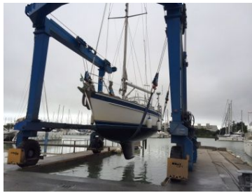
raus aus dem Nass