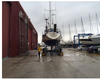
rein in's Trockene