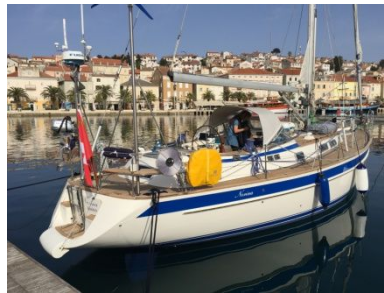
Lojini .. noch verträumt