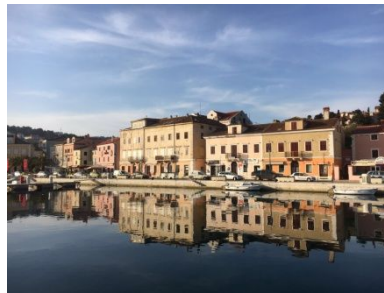
Mali ... verspiegelt schön!