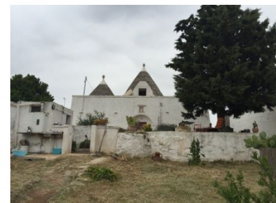
Trulli von Bruna & Remo, Rustico al Ital