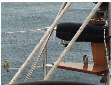
Ausruhen / Schutz vor Gewitter