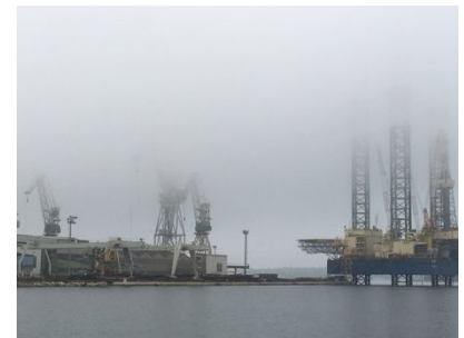
Pula 1, Industry .....