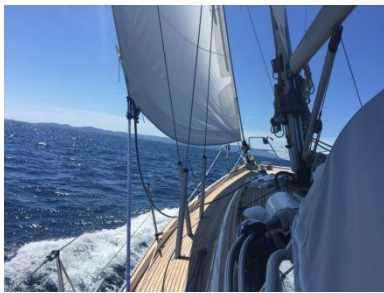
..... endlich wieder unterwegs