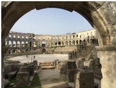
und Pula 2 .....geschichtsträchtig!