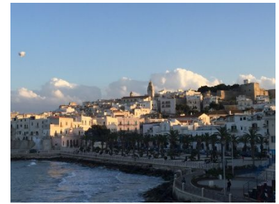
Vieste? Pulien? wer kennt das schon?