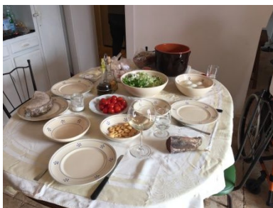
Gastfreundschaft mit Eigenprodukten