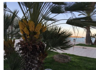
Frühling in Italien