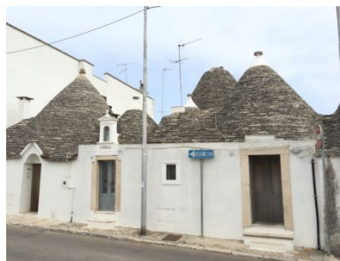
Pulien .. Alberobello ???