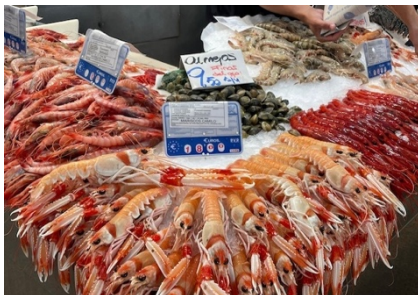
.... wieder im Atlantik, reichhaltiger Fischmarkt