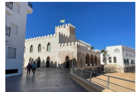
Chipiona an der Gualdalquivir-Mündung