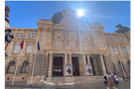
mit schönen erhaltenen Gebäuden