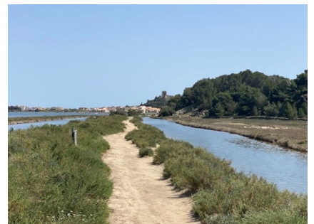
entlang dem Canal du Midi nach Narbonne