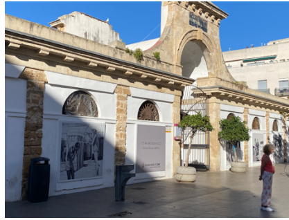
Eingang zum Markt in Cadiz