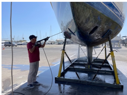
... dann ist auch Arbeit angesagt