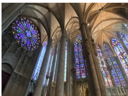
... und der imposanten Kathedrale