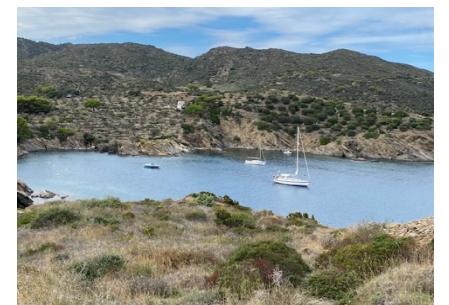
Cala Colliures (F)