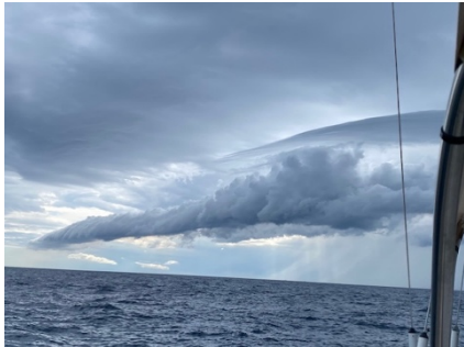
Wolkenband über dem Golf du Lion