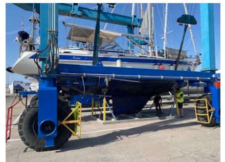
Einwassern nach den Überholungsarbeiten