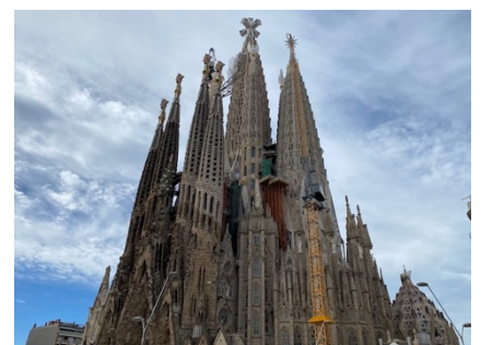
Barcelona's endloses Bauwerk, Sagra Familia