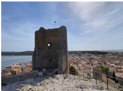
Gruissan mit Barbarossa