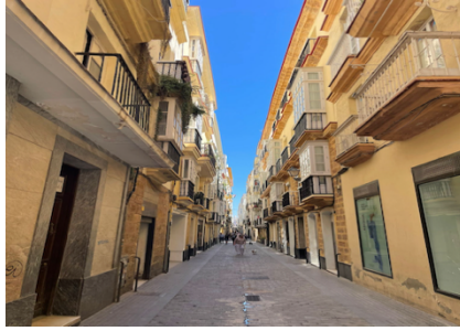
Typische Gassen von Cadiz