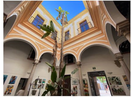
Typischer spanischer Innenhof