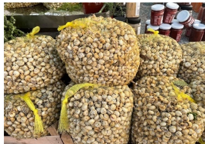
mit regionaler Spezialität Seeschnecken-Suppe