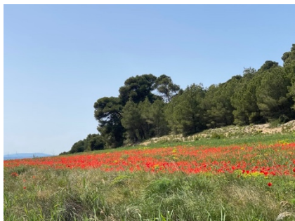
«Moon ist auch eine Blume»