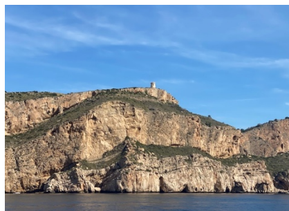
... eines der unzähligen Cap's