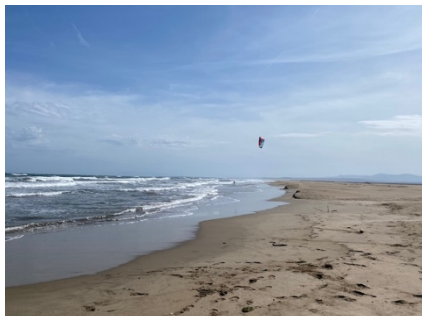
Strandwandern bis in die Unendlichkeit