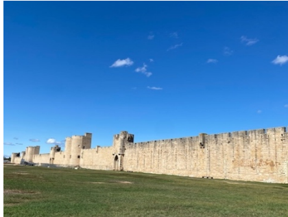
Port Camargues / Aigues Mortes am Canal du Midi, vollständig erhalten mit viel Charme