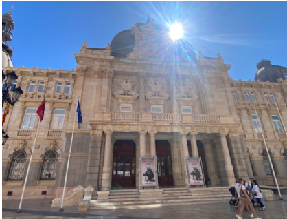
Dancing Academy Cartagena