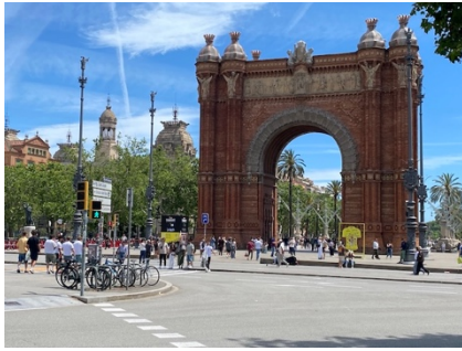
und vielen Sehenswürdigkeiten, Museen und Parks