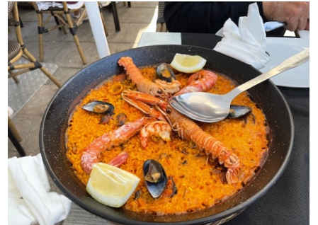
und auch das gehört zu Catalonien