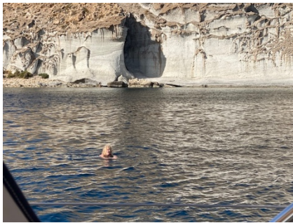
Cala San Pedro, 19 Grad vor herrlicher Klippe