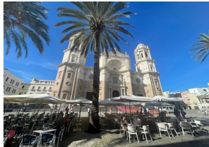
Cadiz, älteste intakte Stadt, über 3000 Jahre