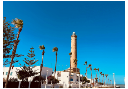
Angeblich höchstes Feuer Westeuropas, 69 m